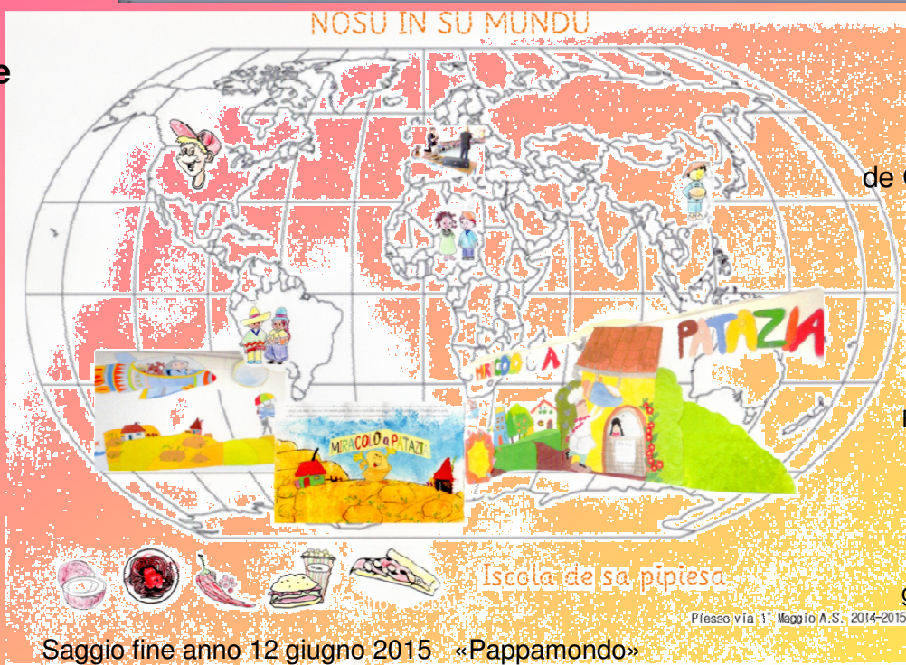
Saggio fine anno 12 giugno 2015 «Pappamondo»